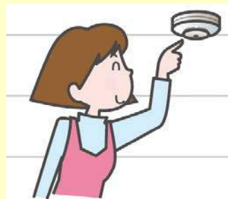
定期的な作動確認

作動確認をしても警報器に反応がなければ、本体の故障か電池切れです。警報器本体を交換しましょう。（※2）