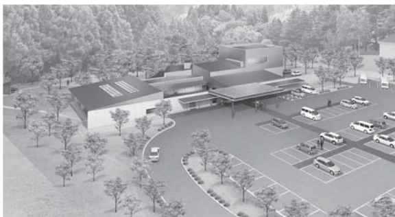
国道側から見たイメージ

場所 久慈市夏井町鳥谷地内（国道45号沿い） 敷地面積 15,119.49㎡ 駐車台数 80台（マイクロバス4台を含む） 建物構造 鉄筋コンクリート造（一部鉄骨造）2階建て 延床面積 1,642.49㎡