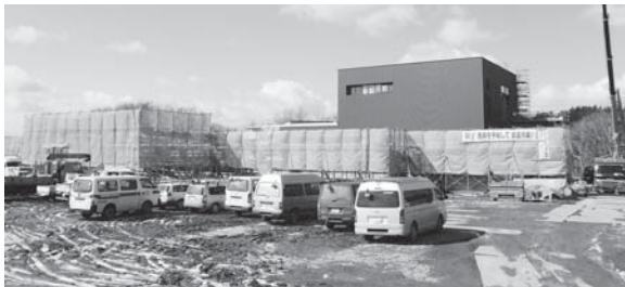
建設工事の状況（3月11日現在）

平成24年4月に着手した新火葬場建設工事は、基礎工事が完了し、内装工事などの建築主体工事や火葬炉、屋内配管などの設備工事を行っています。今後は、駐車場などの外構工事に着手するなど建設工事が順調に進められています。