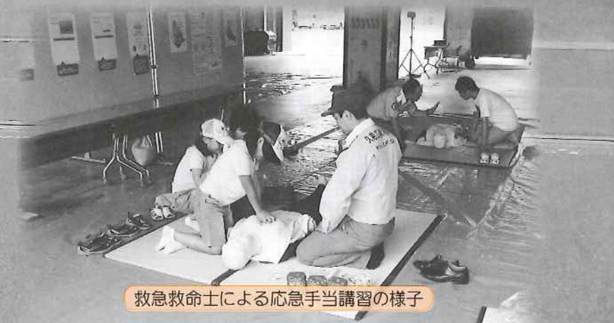
救急救命士による応急手当講習の様子