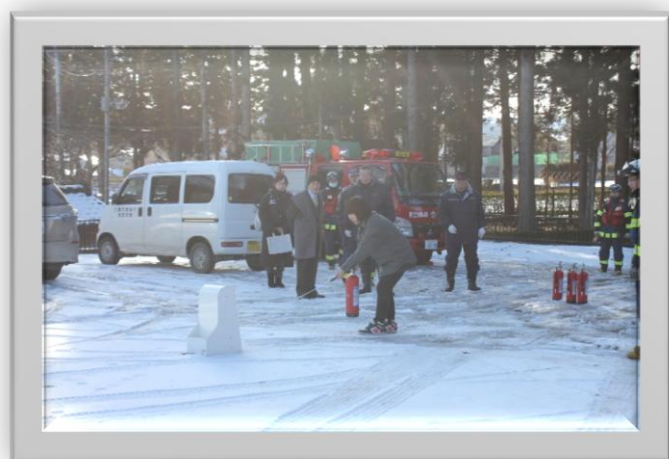
水消火器を使用した初期消火訓練の様子