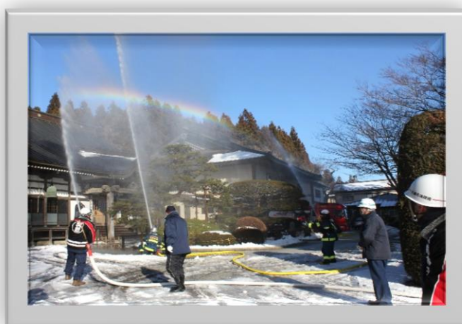
火災防御訓練の様子